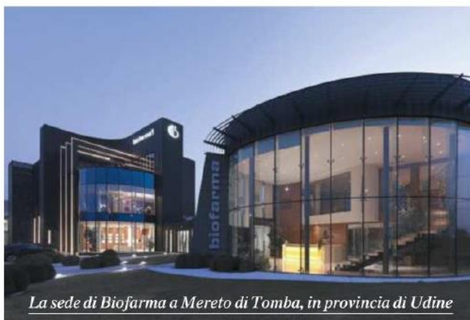
La sede di Biofarma a Mereto di Tomba, in provincia di Udine

100% del gruppo friulano di 1,1 miliardi di euro. La società ha sede a Mereto di Tomba, in provincia di Udine, ed è nata nel 2020 dalla fusione tra Nutrilinea e Biofarma, entrambe controllate all'epoca da White Bridge investments. (riproduzione riservata)